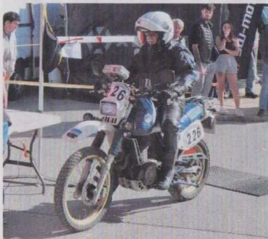
▲ Guy Marchand prend le départ sur sa Suzuki 600 DR.